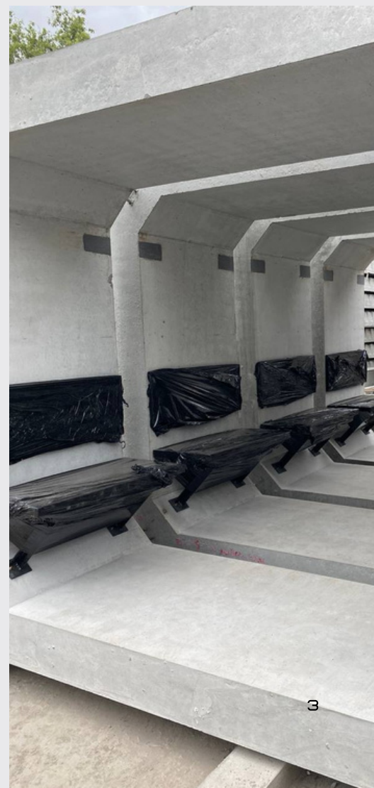
ЗА БАЖАННЯМ МОДУЛІ КОМПЛЕКТУЮТЬСЯ ДЕРЕВ'ЯНИМИ ЛАВОЧКАМИ ТА МЕТАЛЕВИМИ ДВЕРИМА